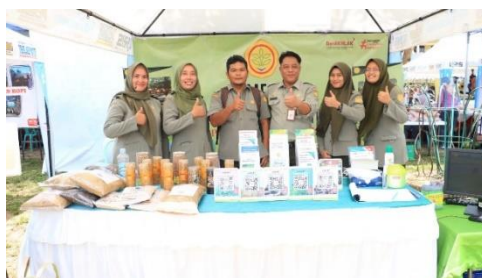
Gambar 10. Dokumentasi Pameran Bulan Bhakti Peternakan