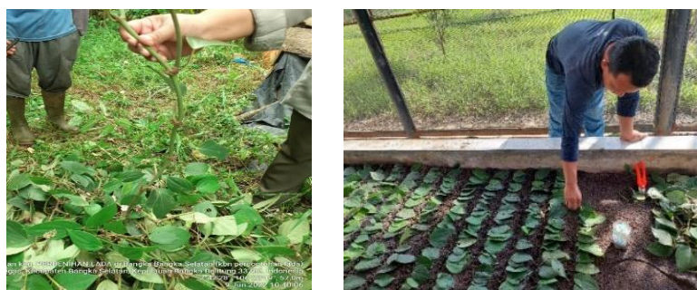
Gambar 4. Dokumentasi kegiatan perbenihan lada

Sukri di Kecamatan Simpang Katis. Sampai dengan Desember 2022 telah dilakukan pengajuan sertifikasi untuk 6208 benih (Petaling 1) dan 2740 (Nyelungkup). Tim Pengawas Benih Tanaman BPSMB Provinsi Bangka Belitung telah melakukan pemeriksaan benih. Hasilnya sebanyak 4273 benih (Petaling 1) dan 993 benih (Nyelungkup) telah dinyatakan lulus sertifikasi.