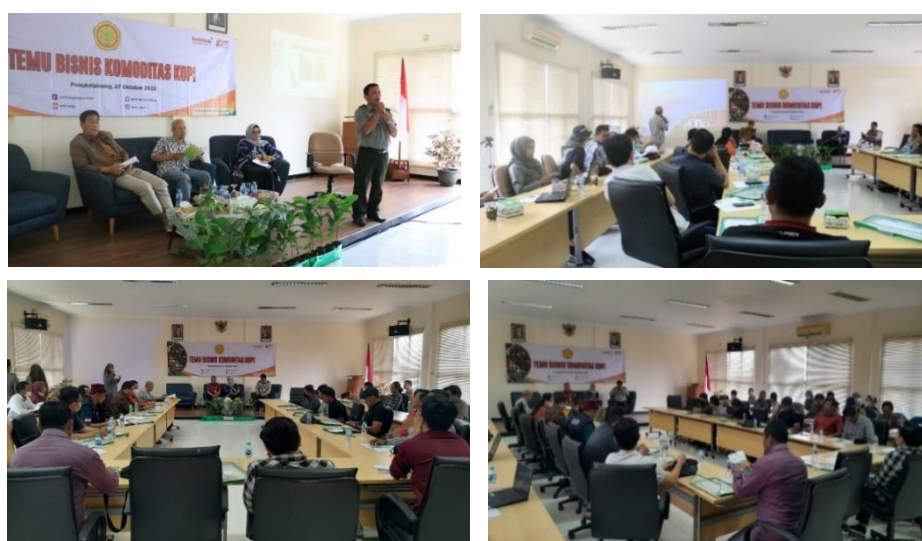
Gambar 14. Dokumentasi Kegiatan Temu Bisnis Kopi

Bangka Belitung terkenal dengan “1001 warung kopi” dan dikenal sebagai Bangka Belitung dikenal juga sebagai kota sejuta kopi. Banyak kedai kopi sederhana hampir disetiap sudut kota yang tidak pernah sepi oleh pengunjung. hal ini disebabkan tradisi minum kopi pada masyarakat Bangka Belitung telah ada sejak zaman kolonial Belanda. Namun pemenuhan kebutuhan kopi masih didatangkan dari luar, seperti Palembang dan Lampung. Salah satu alasannya adalah masih kurangnya produksi kopi di Bangka Belitung.