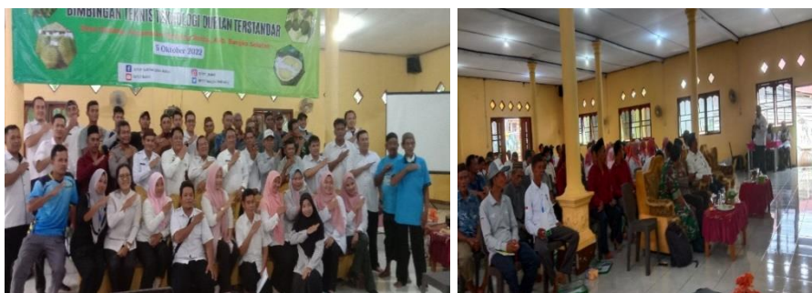
Gambar 1. Dokumentasi Bimtek budidaya durian terstandar

Materi pada kegiatan bimtek ini adalah teknis budidaya durian terstandar termasuk pengendalian organisme pengganggu tanamannya dan praktek grafting / sambung pucuk durian yang disampaikan oleh pegawai BPTP Kep. Bangka Belitung. Pelaksanaan bimtek ini merupakan tindaklanjut dari kegiatan tanam perdana yang diharapkan dapat memberikan wawasan kepada petani dalam melakukan budidaya durian yang sesuai standar sehingga dapat memberikan hasil yang optimal.