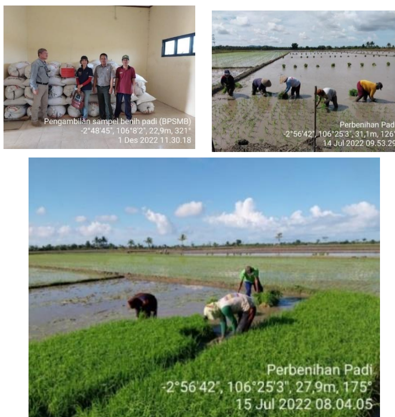
Gambar 2. Dokumentasi kegiatan perbenihan padi