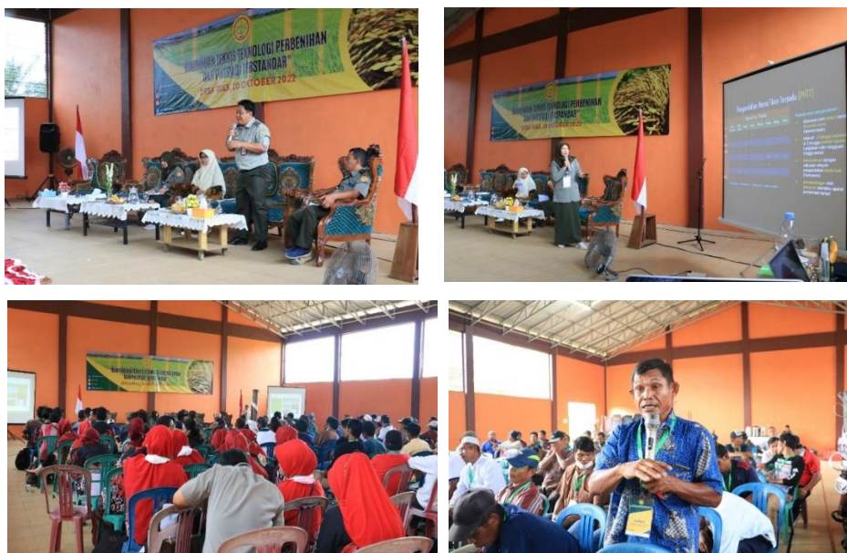
Gambar 13. Dokumentasi kegiatan bimtek Perbenihan dan PHT padi