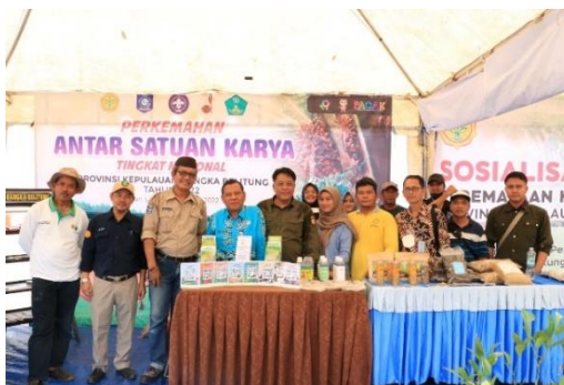
Gambar 11. Dokumentasi Pameran Saka Taruna Bumi