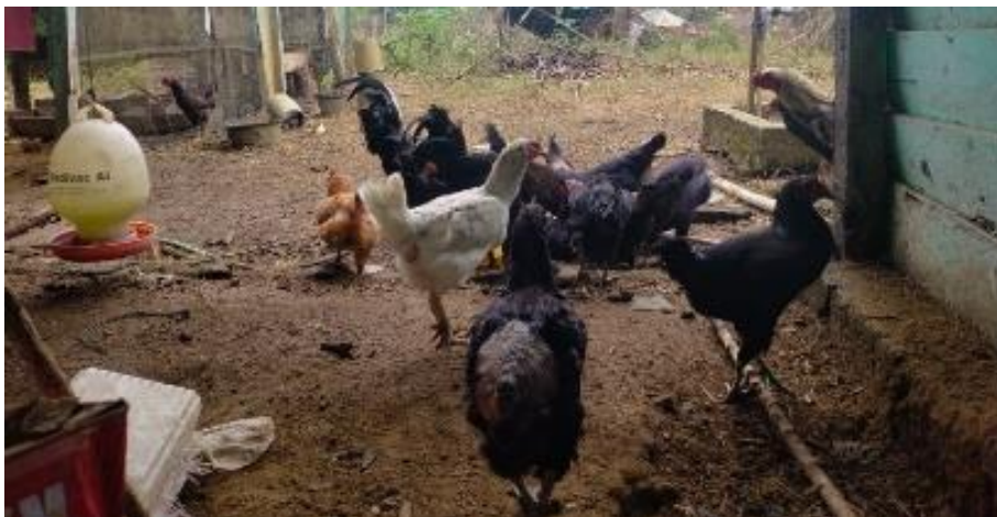
Gambar 1. Display budidaya sapi dan ayam KUB