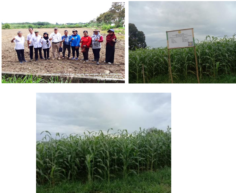
Gambar 6. Dokumentasi kegiatan perbenihan sorgum

kondisi tersebut adalah melakukan sortasi bulir normal sesuai kriteria benih sorgum dan waktu penjemuran bulir sekitar 1 minggu. Saat ini benih yang dihasilkan dalam tahapan sertifikasi dan menunggu sertifikat dari BPSMB.