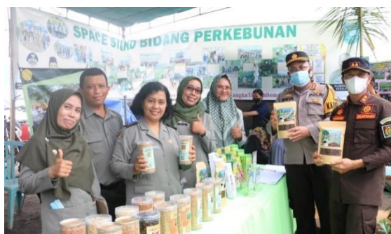
Gambar 12. Dokumentasi Temu Lapang dan Penyuluh