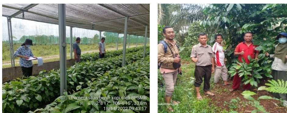
Gambar 3. Kegiatan perbenihan kopi robusta

Pengajuan usulan dari Bangka Tengah sebanyak 17 poktan/gapoktan dan kabupaten Bangka dua poktan/gapoktan. Jumlah benih yang tersedia lebih sedikit maka dilakukan prioritas poktan/gapoktan yang akan memperoleh bantuan benih. Kerriteria poktan/gapoktan penerima benih harus memiliki lahan yang siap tanam dan memiliki minat yang tinggi untuk menanam kopi. Dari hasil verifikasi CPCL, poktan/gapoktan penerima benih adalah gapoktan sejahtera desa Kemuja kabupaten Bangka (3.000 benih), poktan desa Jelutung Bangka Tengah (5.000 benih) dan poktan desa Lampur (2.000 benih).