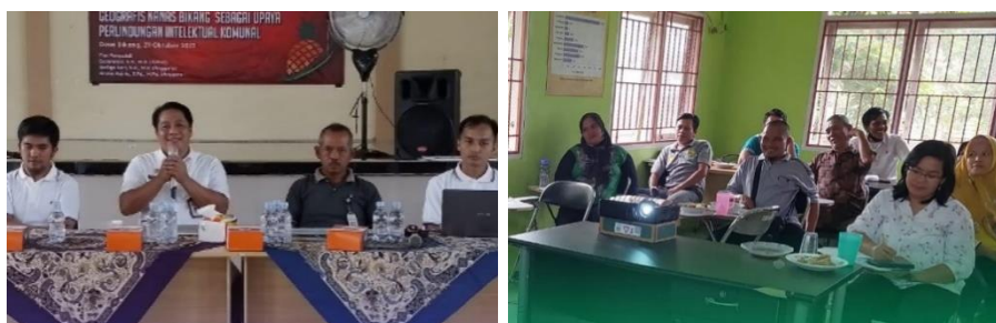
Gambar 9. Permohonan narasumber dari stakeholders

Pada tahun 2022, Balai Pengkajian Teknologi Pertanian Kepulauan Bangka Belitung telah memenuhi 13 permintaan pengisian materi (narasumber). Adapun rekap narasumber dan materi yang diberikan disajikan pada Tabel 9.