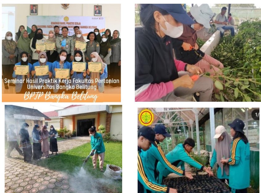
Gambar 8. Kegiatan Magang di BPTP Bangka Belitung

Pelayanan Magang kerja digunakan SMK Negeri 1 Pulau Besar sebanyak 24 orang siswa dan Fakultas Pertanian, Perikanan dan Biologi, Universitas Bangka Belitung sebanyak 8 mahasiswa, dan Fakultas Pertanian Universitas Sriwijaya sebanyak 1 orang. Siswa dan mahasiswa mempelajari berbagai teknologi pertanian seperti bertanam sayuran secara hidroponik, budidaya lada, budidaya karet, perbenihan kopi, perbenihan lada, ayam KUB, pengomposan, perbanyak durian namlung dll.