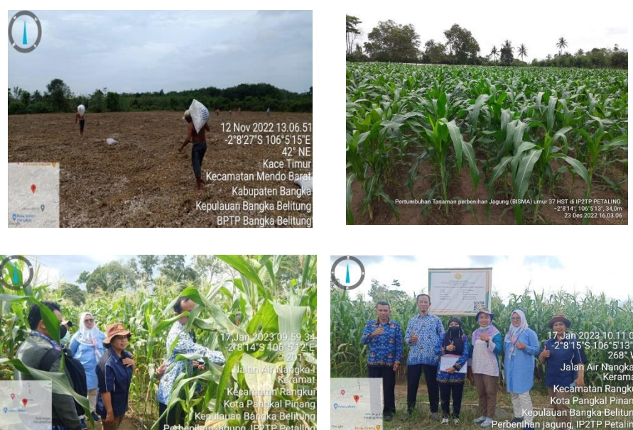
Gambar 5. Dokumentasi kegiatan perbenihan Jagung

Pada tanggal 17 Januari 2023 telah dilakukan pengecekan fase generatif oleh tim BPSMB Porpinsi Kepulauan Bangka Belitung. Hasil pengecekan menunjukkan ada beberapa tanaman yang menunjukkan penyimpangan dari deskripsi varietas sehingga disarankan untuk dilakukan roguing, tapi persentasenya sangat kecil dan dinyatakan layak untuk dilanjutkan ke tahapan berikutnya. Panen dilakukan pada minggu ke-4 Februari 2023 dengan kondisi curah hujan yang tinggi dan adanya serangan OPT seperti penggerek tongkol batang. Kondisi ini mempengaruhi kualitas hasil panen yang berdampak terhadap target output. Saat ini benih dalam tahapan sertifikasi.