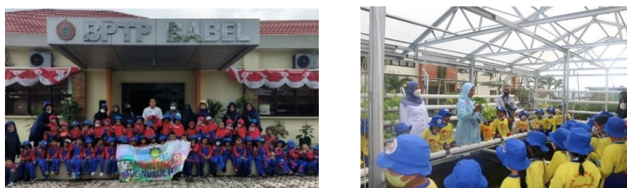
Gambar 7. Kunjungan IP2TP Petaling

Salah satu pelayanan yang diberikan oleh BPTP Kepulauan Bangka Belitung adalah kunjungan ke IP2TP. Pada tahun 2022, terdapat 4 kali kunjungan ke IP2TP Petaling yaitu TK Tidar, TK Nuru Haqi, TK Bahagia, dan Gapoktan KWT Bangka Barat.